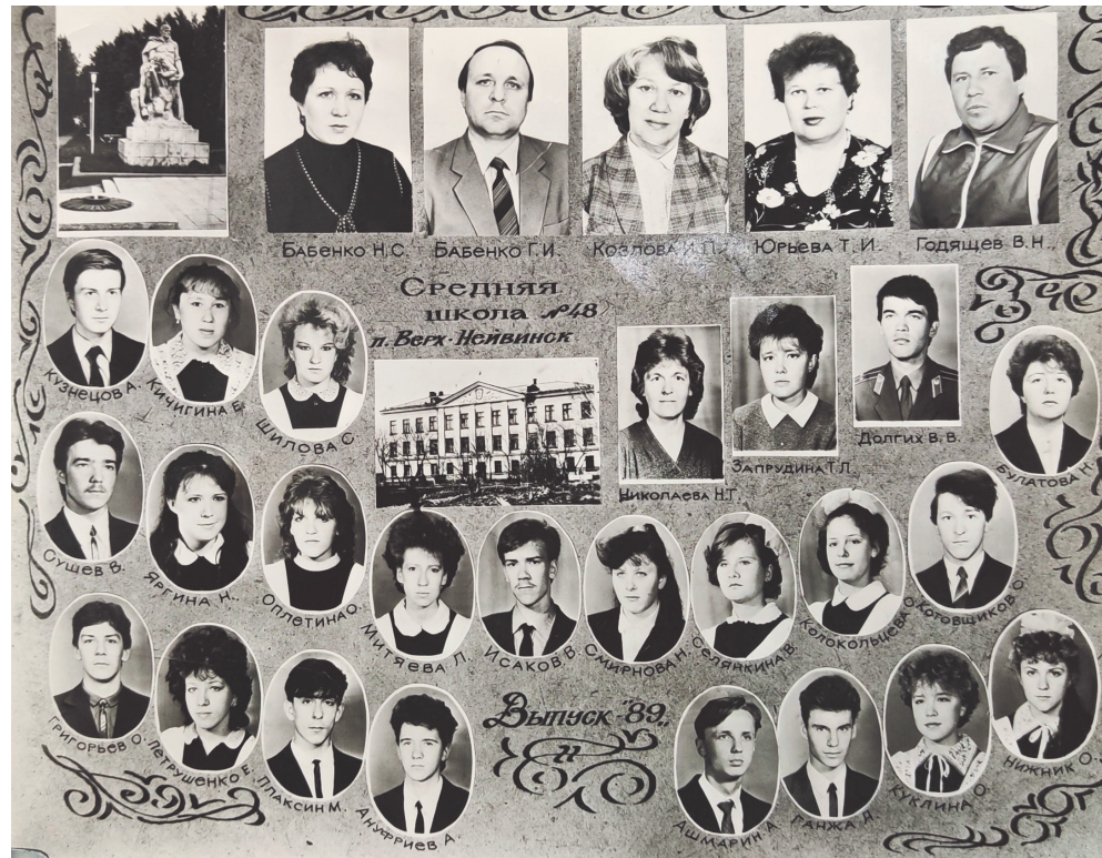
Выпускной класс автора, 1989 г.